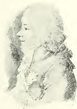
M. DE TALLEYRAND d'après une miniature d'Isabey